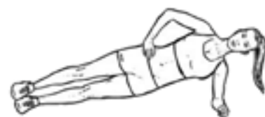
Planche sur le côté